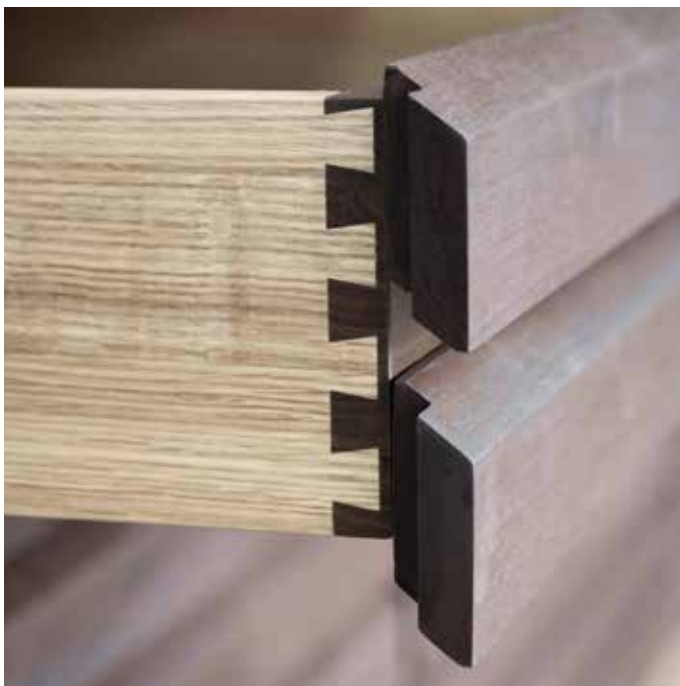
SAMMANFOGNING STANDARD MED LÅDA TYP 2 (EGEN FRONT)