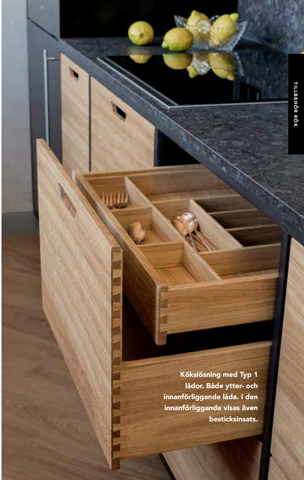
Kökslösning med Typ 1 lådor. Både ytter- och innanförhängande låda. I den innanförhängande visas även besticksinsats.